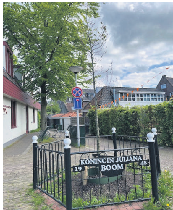
■ De nieuwe Julianaboom aan de Burgemeester de Raadtsingel