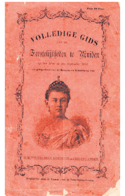
■ Programmaboekje van de feestelijkheden

Op diverse Ansichtkaarten uit het begin van de twintigste eeuw is zichtbaar dat het destijds nog een heel dunne boom was achter een zwart hek. Als we de grote boom nu zien, met een mooi groen hek, mogen we toch zeggen dat het een sieraad van de Herengracht is geworden, tussen de terrassen van de twee restaurants. Aan het hek hangen bakken met fleurige viooltjes. De Wilhelminaboom achter het groene hek met de mooie gouden letters Wilhelmina zien we op bijgaande foto.