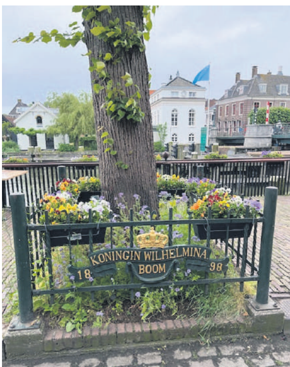
■ De Wilhelminaboom nu