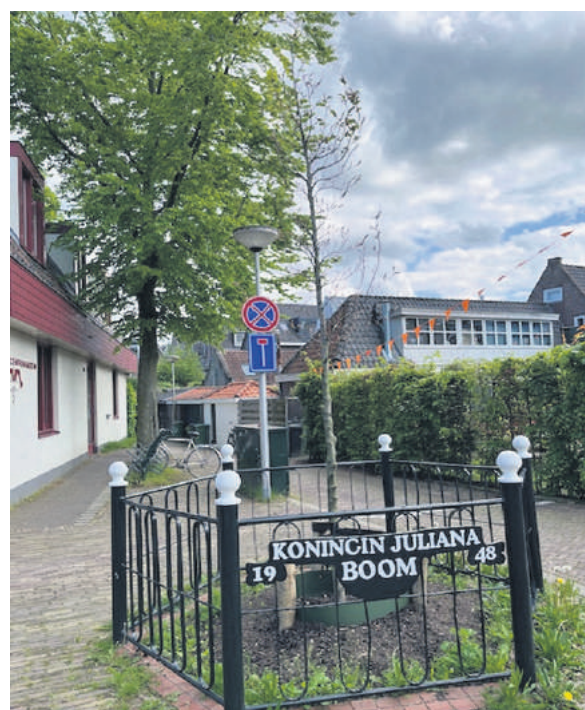
■ De nieuwe Julianaboom aan de Burgemeester de Raadtsingel