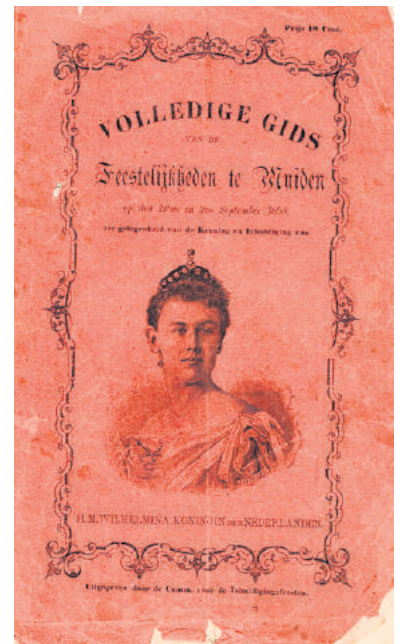
■ Programmaboekje van de feestelijkheden

Op diverse ansichtkaarten uit het begin van de twintigste eeuw is zichtbaar dat het destijds nog een heel dunne boom was achter een zwart hek. Als we de grote boom nu zien, met een mooi groen hek, mogen we toch zeggen dat het een sieraad van de Herengracht is geworden, tussen de terrassen van de twee restaurants. Aan het hek hangen bakken met fleurige viooltjes. De Wilhelminaboom achter het groene hek met de mooie gouden letters Wilhelmina zien we op bijgaande foto.