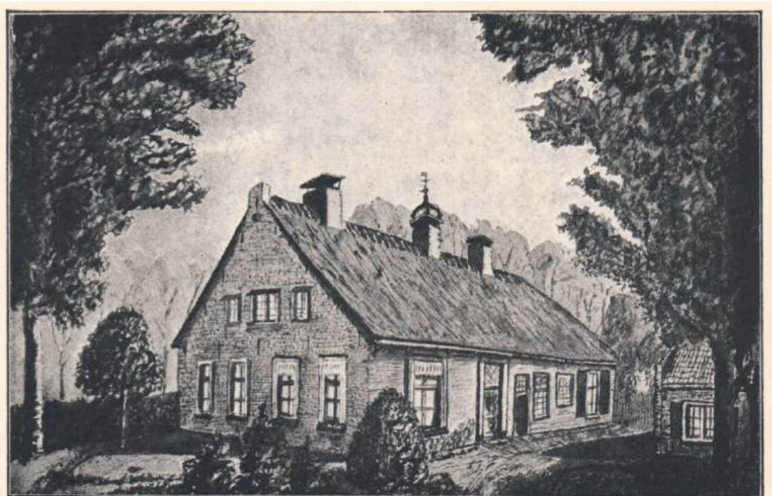
DE VOORMALIGE R. C. SCHUURKERK ALS PASTORIE (VOORGEVEL), LATER DE VILLA „MA CHAUMIÈRE“.