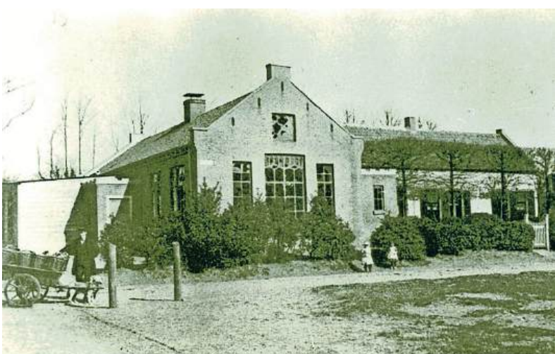
GEMEENTESCHOOL VAN 1864, KORT VOOR DE SLOOPING IN 1899.