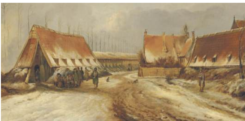
■ Kazematten bij het beleg van Naarden in 1814, geschilderd door Pieter van Os.

"De burgemeesters van Naarden hebben ter voorkoming van brand besloten te verbieden: het afschieten van geweren en pistolen en het afsteken van vuurwerk in het gehucht Bussum ter gelegenheid van Nieuwjaar, op straffe van een boete van drie gulden, waarbij ouders verantwoordelijk worden gehouden voor hun kinderen."