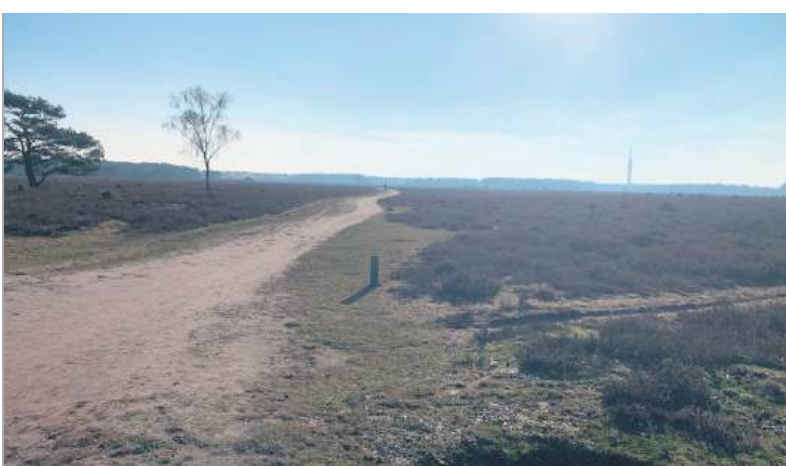
■ VNS: De Kraailoosche weg (nu Oude-Craillooseweg) liep tussen 'Het Hoogt' en 'Hoogen eng' door naar Hilversum. Het is nog steeds een zandpad.