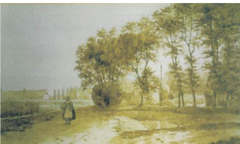
■ Uitzicht naar het noorden vanaf de Herenstraat. Schilderij van Abraham Klinkhamer uit 1859