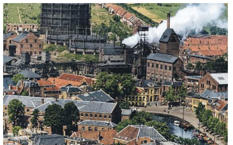
■ Bedrijvencomplex De Heus op Vredenburg Utrecht.