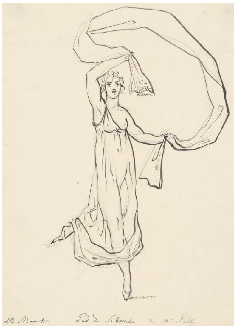
■ Polly Cuninghame.