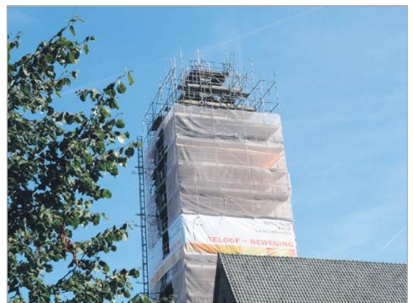
De kerktoren in de steigers in 2006