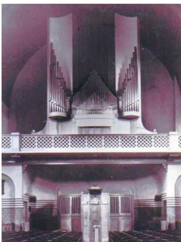
■ Het Flentrop-orgel in de Nederlands Hervormde kerk aan de Huizerweg, de latere Vredekerk.

In 1995 werd de Vredekerk gesloten. Veel kerkgangers pleitten er voor om het unieke orgel voor Bussum te behouden. Al snel werd gedacht aan verplaatsing naar de Wilhelminakerk. Maar daar hing