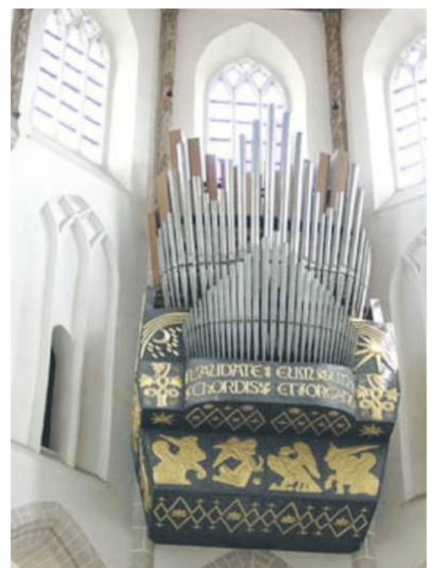
■ Het koororgel in de Grote Kerk van Naarden.