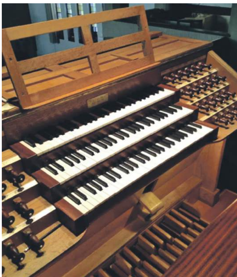
■ De speeltafel van het Flentrop-orgel.