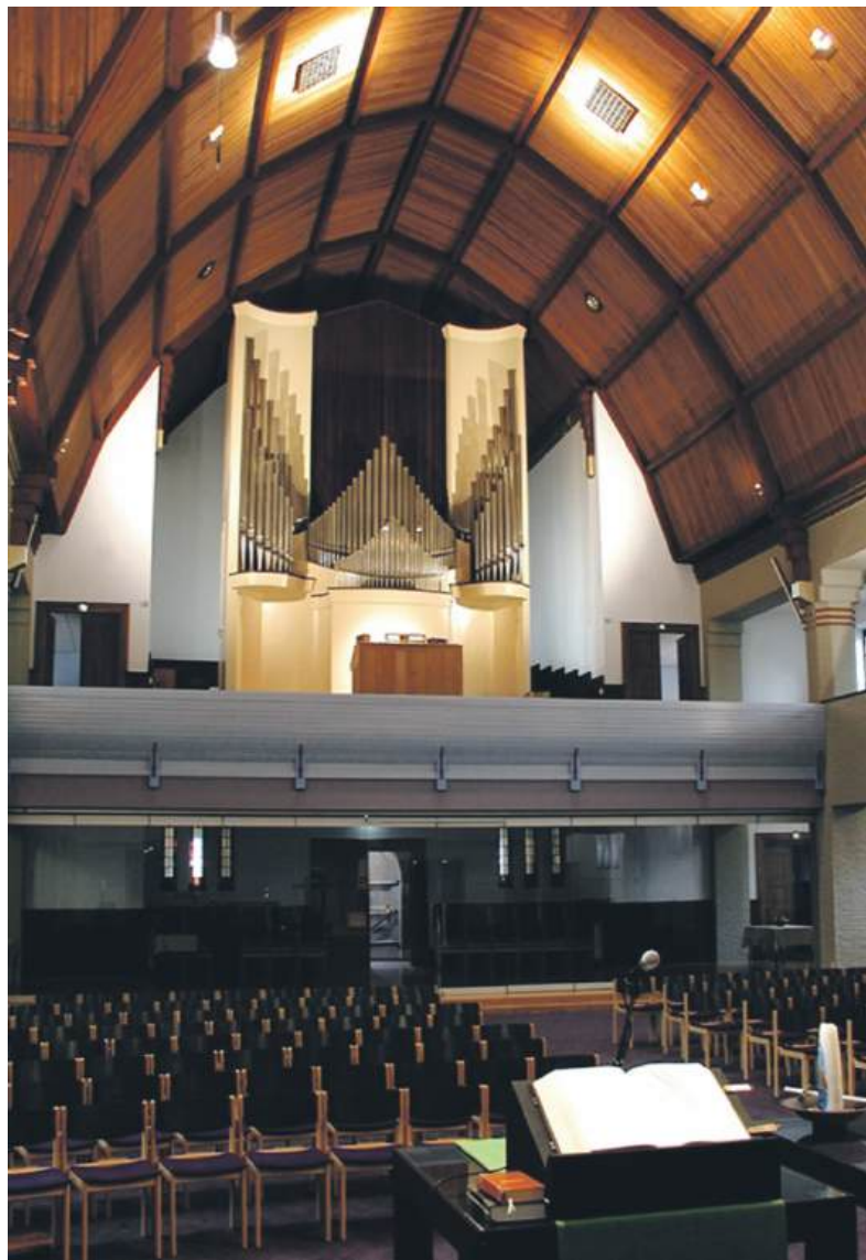
■ Het Flentrop-orgel in de Wilhelminakerk.